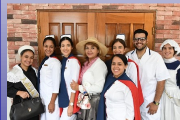
Participantes del Culto