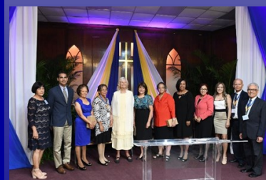
Reconocimiento a la Escuela de Enfermería y Ciencias de la Salud